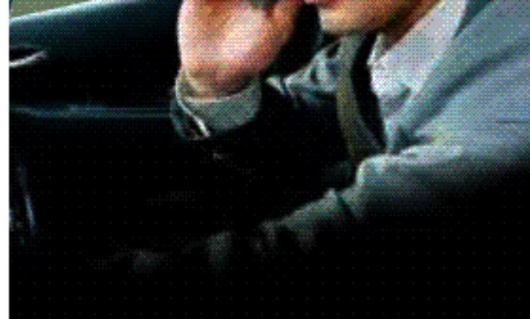
Propagační akce Ministerstva dopravy ČR